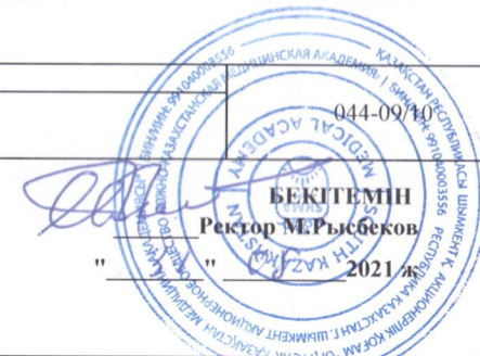
График учебного процесса образовательной программы для прикладного бакалавриата на 2021-2022 уч.года

2021-2022 оқу жылы қолданбалы бакалавриат білім беру бағдарламасы оқу үдерісінің кестесі/